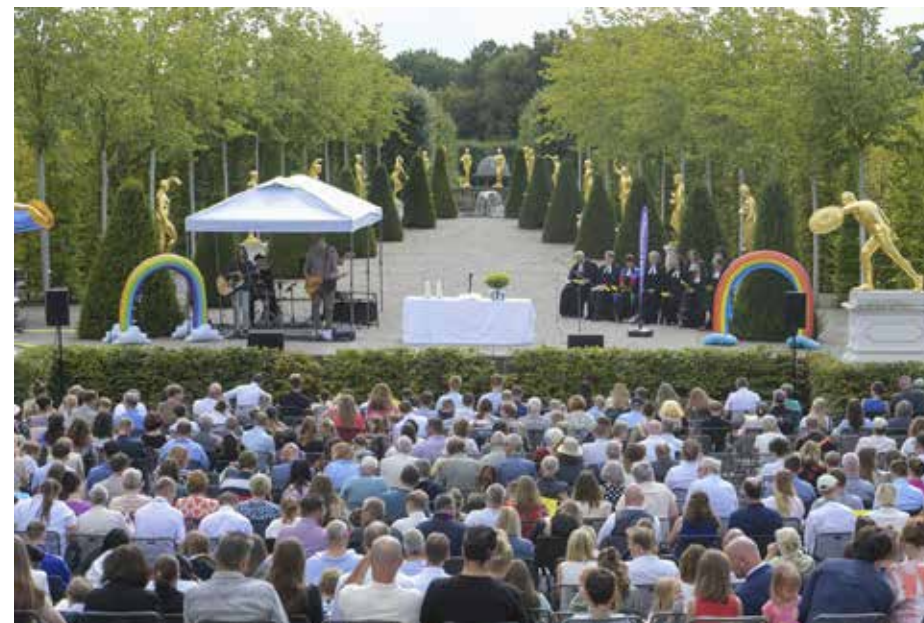
Tauffest 2025 in den Herrenhäuser Gärten