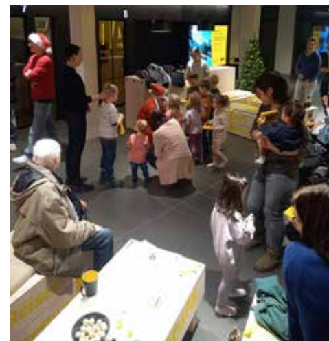
Zusammenkommen im Advent, hier beim ADAC