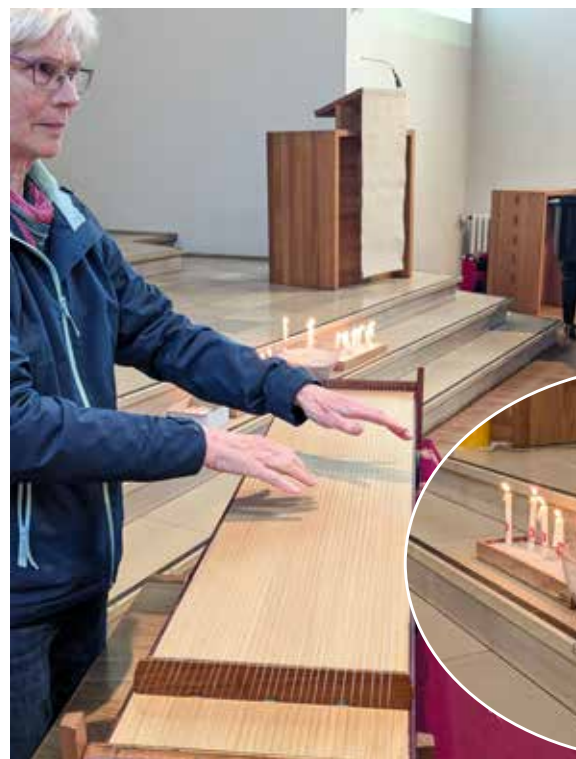
Unten: Das Hagios-Gebet am 24.04.: ein meditativer Abend mit viel Gesang.