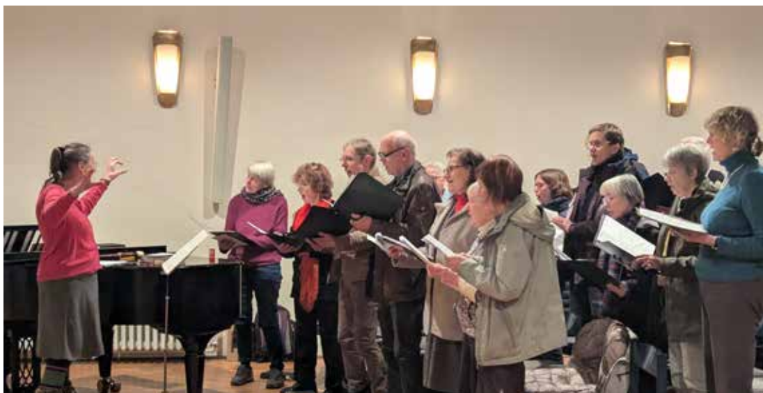
Oben: unser Projektchor im Gottesdienst